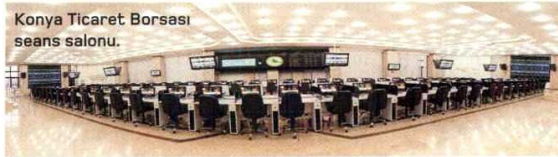
Konya Ticaret Borsası seans salonu.

"Bu depolar sayesinde üretici ürününü gerçek değerinde satıyor, sanayici hammadde temininde sıkıntı yaşamıyor. Finansal yatırımcılar da bu lisanslı depoculuk belgelerini satın alarak ayrıca para ka-