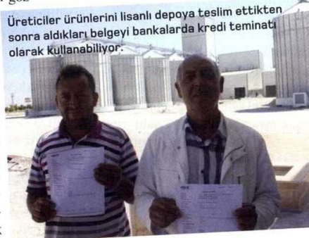
Üreticiler ürünlerini lisanslı depoya teslim ettikten sonra aldıkları belgeyi bankalarda kredi teminatı olarak kullanabiliyor.

Bu kanunla lisanslı depoya tevdi edilen ürün için üreticiye verilen ürün senetlerinin el değiştirmesinden doğan kazançlar 31/12/2018 tarihine kadar gelir vergisi ve kurumlar vergisinden istisna tutuldu. Ürünlerin lisanslı depolara ilk tesliminde ve borsadaki alım satımında katma değer vergisi (KDV) istisnası getirildi. Lisanslı depo işletmesi ile mudi arasında yapılan sözleşmeler ve ürün senetleri damga vergisinden istisna tutuldu. Lisanslı depoculuk hizmetleri bölgesel desteklerden yararlanılacak yatırımların