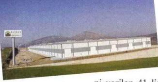
Elidaş Lisanslı Depo

klasik depoculuktan çıkacağıni açıklamasının sistemin gelişmesini sağladığını vurguluyor. Çevik sözlerini şöyle sürdürüyor: