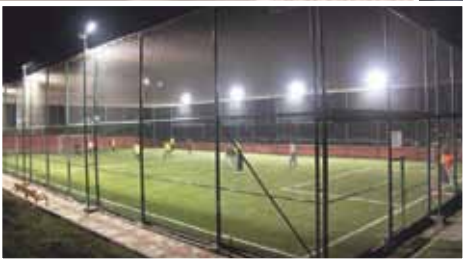
Sosyal Aktiviteler • Social Activities*