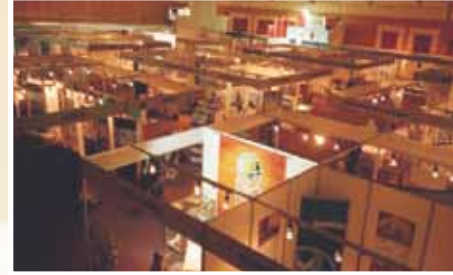
Sergi • Exhibition