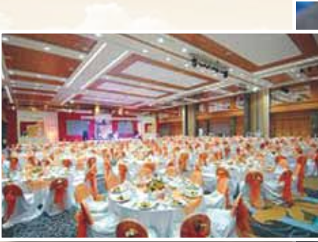
Gala Gecesi • Eğlence Gala Dinner • Entertainment