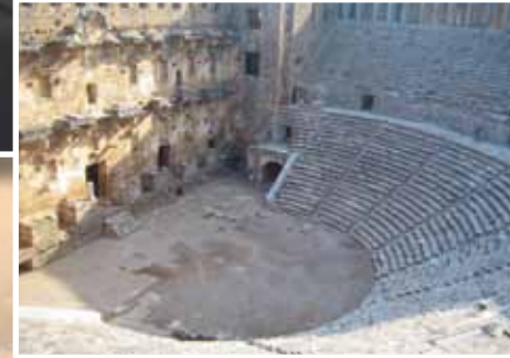
Gezi • Tours

(*)Dernekler arasında Futbol Turnuvası • Soccer Tournament among our Associations