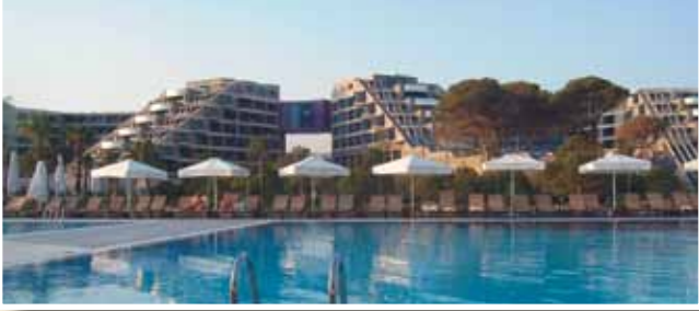
İkili Görüşmeler • Bilateral Meeting