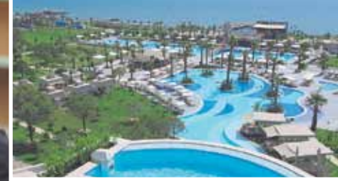
Susesi Luxury Resort Hotel