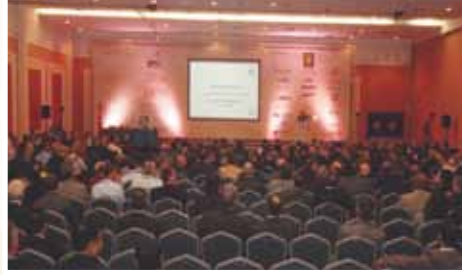
Toplantı • Meeting