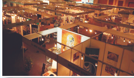
Sergi • Exhibition