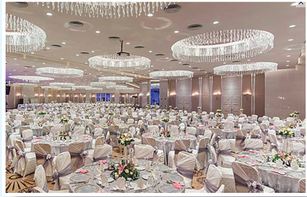
Gala Gecesi • Eğlence Gala Dinner • Entertainment