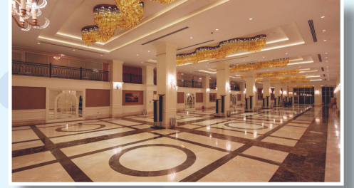
Fuaye • Exhibition Area