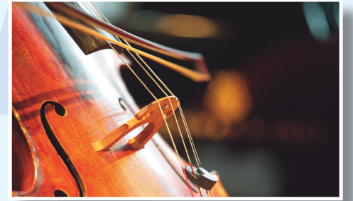
Hoşgeldiniz Kokteyli Welcoming Cocktail