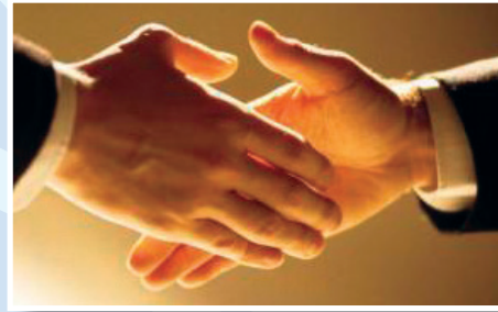
İkili Görüşmeler • Bilateral Meeting